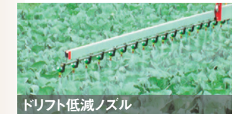
ドリフト低減ノズル

ドリフト低減ノズルの利用 : 従来のノズルに比べ、飛散量を数分の1以下に低減できる。