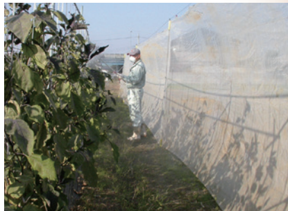
飛散防止ネットの利用例

畑の周囲や境界に、障壁となる飛散防止ネットを設置したり、障壁作物(ソルゴーなど)を植栽する。